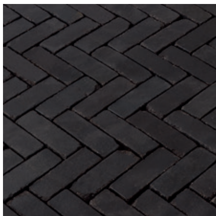
Terra Carbona antica

Für die Beantwortung allfälliger Fragen stehen wir Ihnen gerne zur Verfügung.